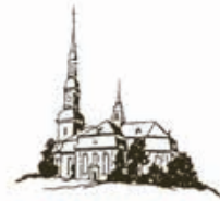
ST. TRINITATIS ALTONA

Hauptkirche St. Trinitatis Altona Postadresse und Kirche: Kirchenstraße 40, 22767 Hamburg Büro und Kapelle: Königstraße 11 info@hauptkirche-altona.de www.hauptkirche-altona.de